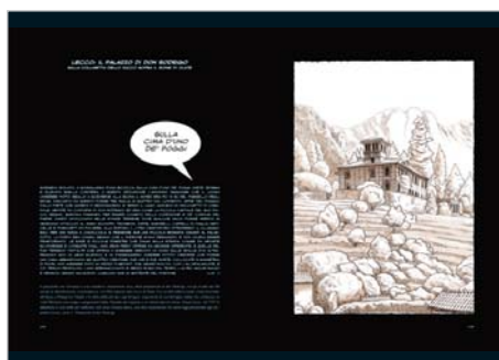
Lecco: il palazzo di don Rodrigo