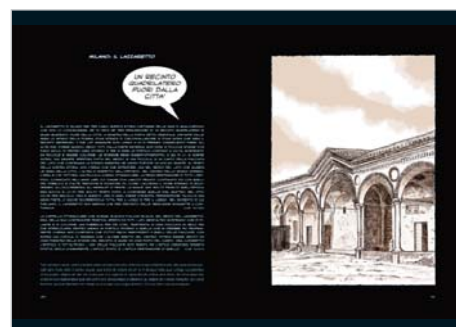
Milano: il Lazzaretto