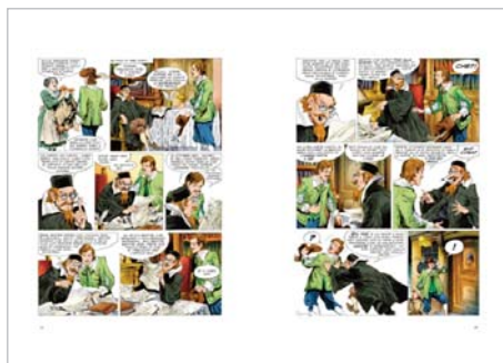
Renzo da Azzecagarbugli