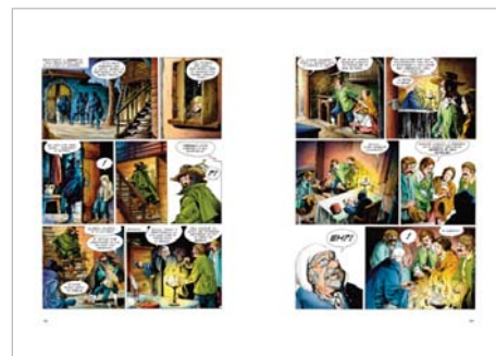
La notte degli imbrogli