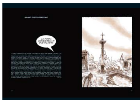
Milano: porta Orientale