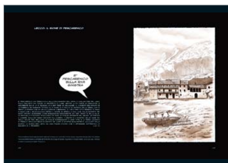
Lecco: il rione di Pescarenico