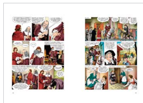
La conversione dell'Innominato