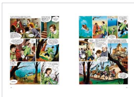
Il rapimento di Lucia