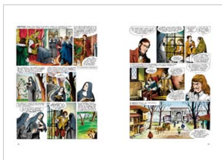
La monaca di Monza