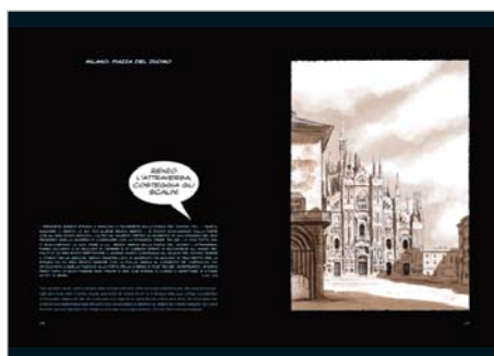
Milano: piazza del Duomo